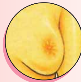
D. Cambios en el pezón, como retracción o inversión del pezón.