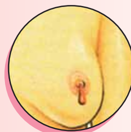
E. Sangre o secreción de cualquier color del pezón (una secreción clara, verdosa o de leche, es normal, si se debe a una presión del pezón)