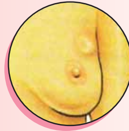
A. Tumor visible

Frecuentemente, el cáncer al seno provoca cambios en los senos que uno puede notar fácilmente. A continuación algunos cambios peligrosos que vienen a ser como "señales de alarma"